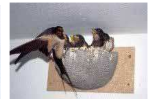
H. fenêtre nids à l'extérieur